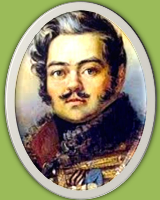
Денис Васильевич Давыдов