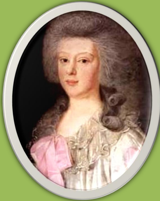
Мария Денисовна Ермолова (Денисова)