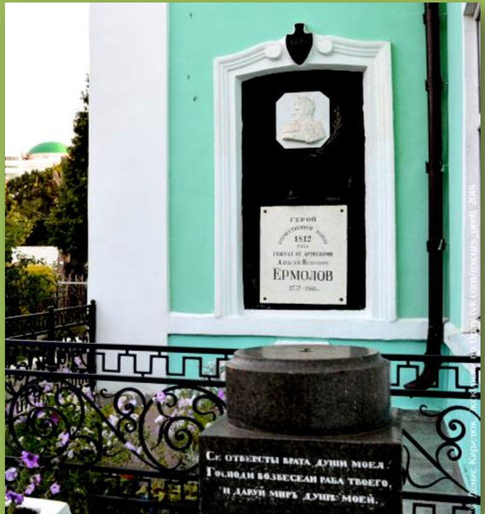
Могила А.П. Ермолова на Троицком кладбище в Орле.

Алексей Петрович был погребён на Троицком кладбище в семейной усыпальнице Ермоловых.