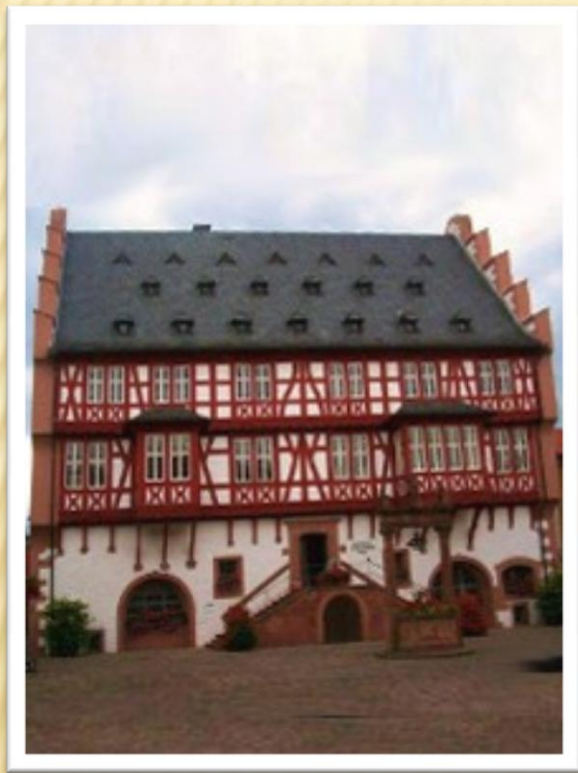
Дом, в котором родились братья Гримм

В этом городе в семье известного адвоката Филиппа Вильгельма Гримм и его супруги Доротеи родились шестеро детей: сыновья Якоб Людвиг Карл, Вильгельм Карл, Карл Фридрих, Фердинанд Филипп, Людвиг Эмиль и дочь Шарлотта Амалия.