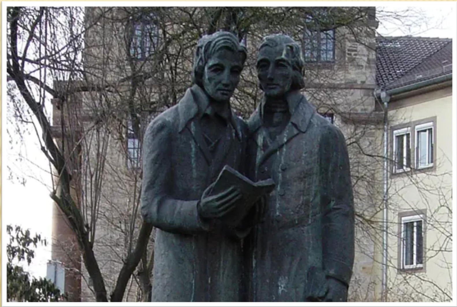
Памятник Якобу и Вильгельму Гримм в Касселе