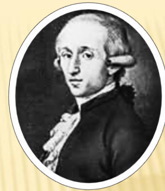
Филипп Вильгельм Гримм