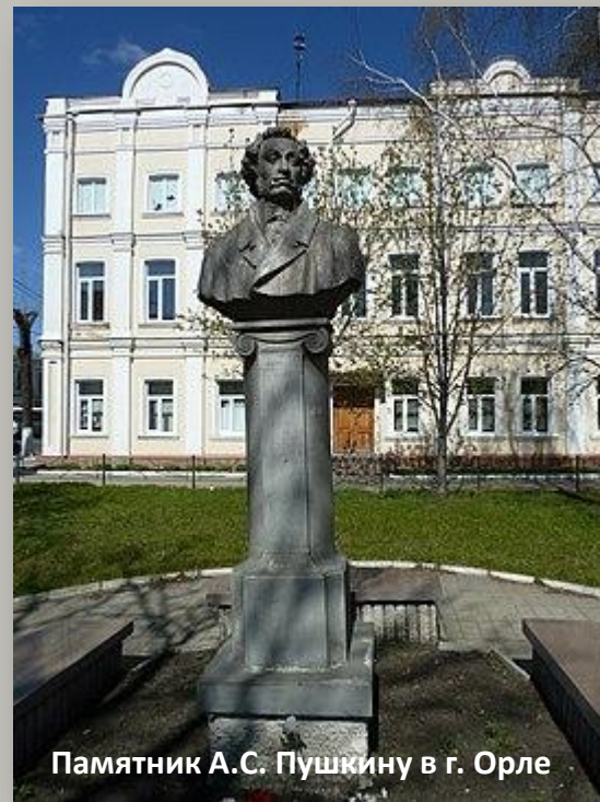
Памятник А.С. Пушкину в г. Орле

Памятник расположен в сквере на улице Московской перед одним из корпусов Государственного университета им. Тургенева.