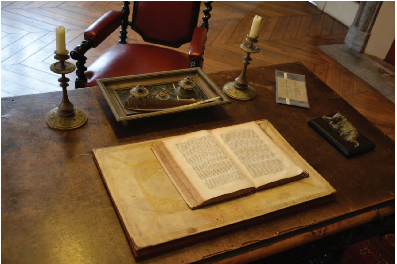
Буживаль. Письменный стол Тургенева