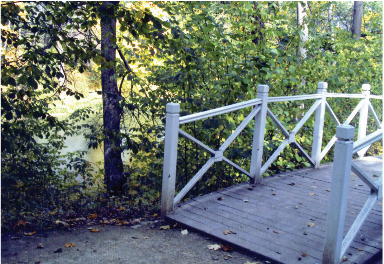
У пруда Савиной