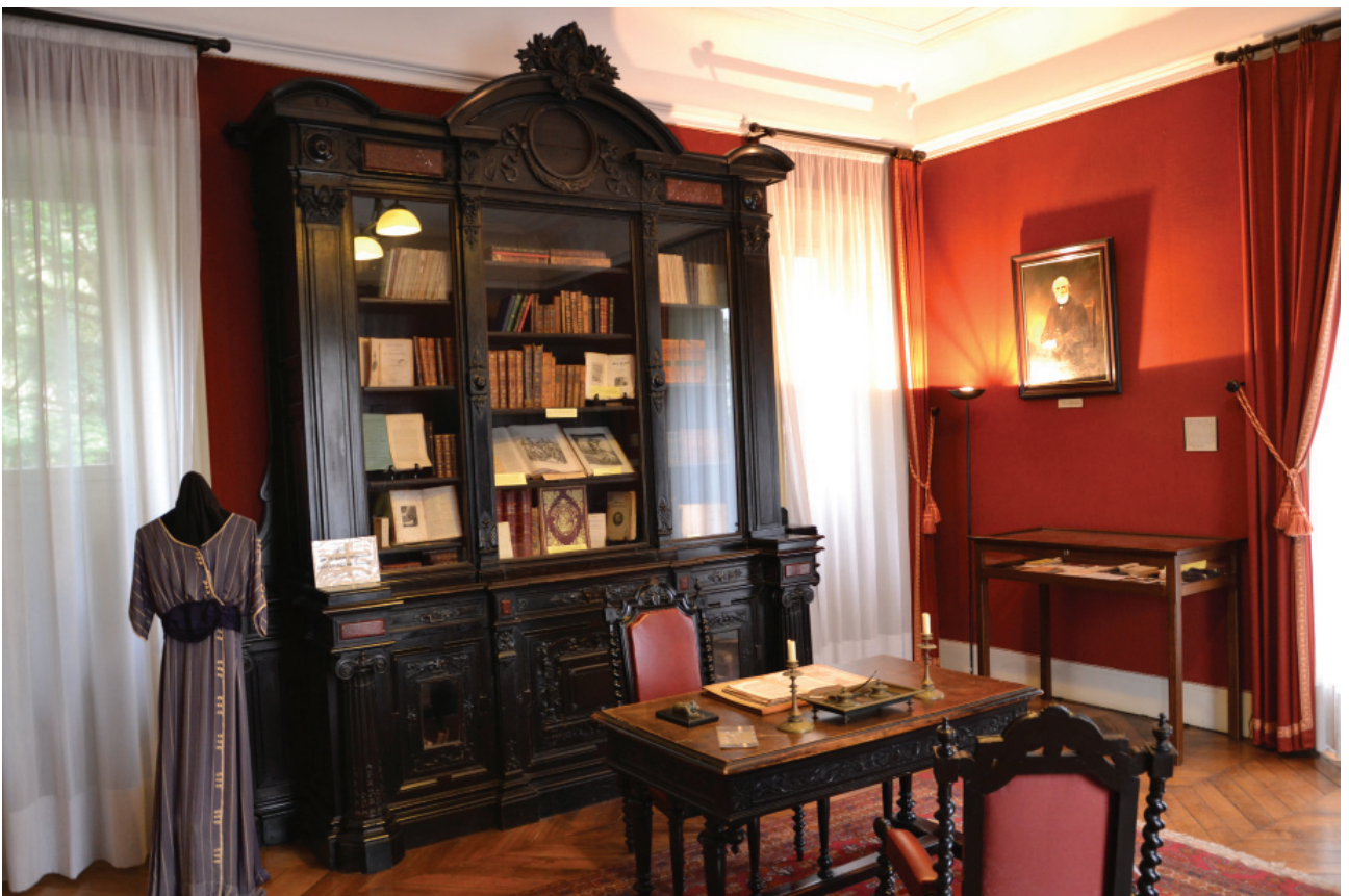
Буживаль. Кабинет Тургенева