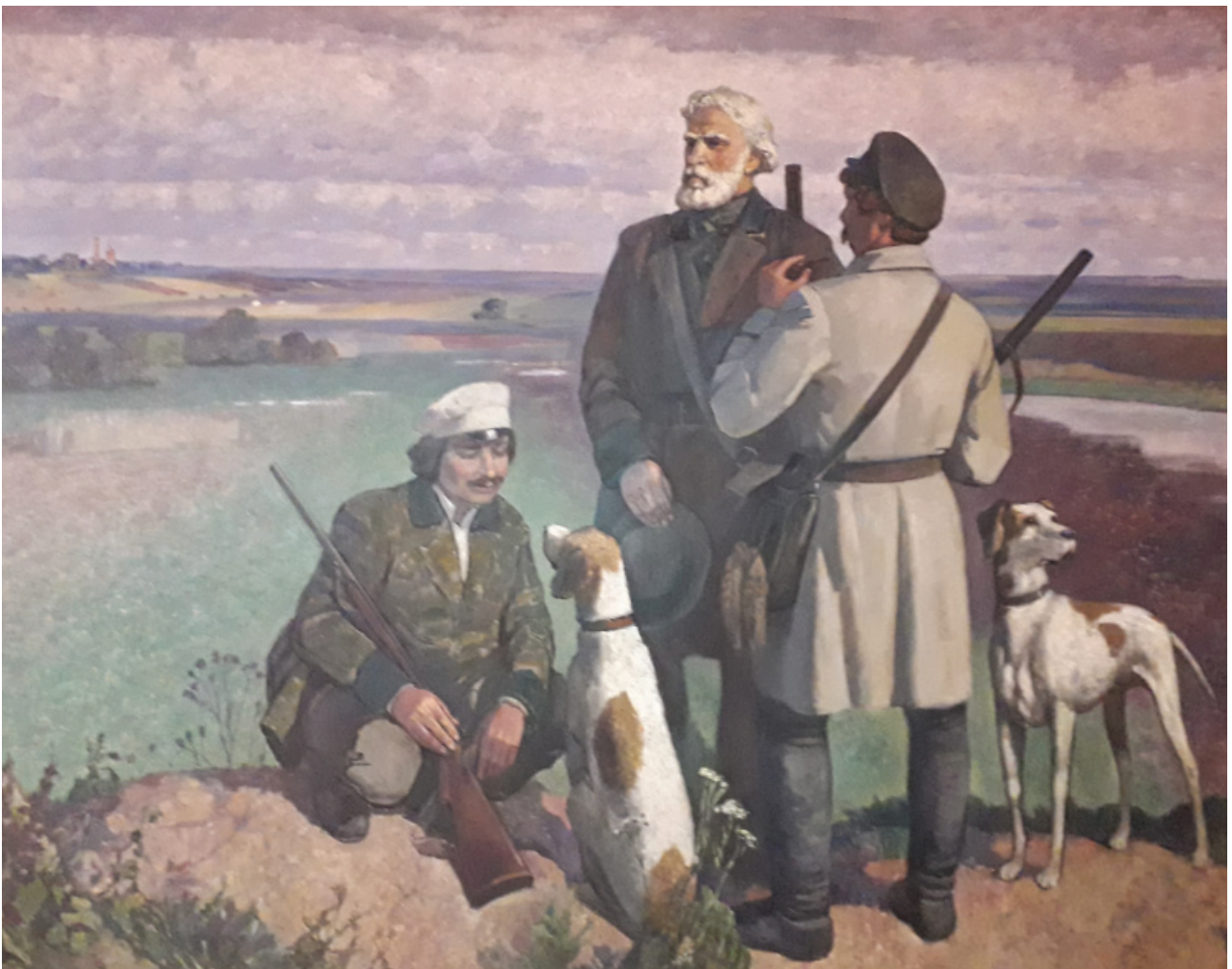
Картина «Тургенев на охоте»