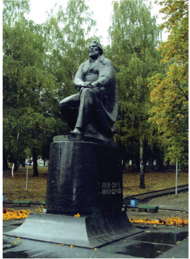
Памятник Тургеневу Ивану Сергеевичу в начале Парка культуры в Орле