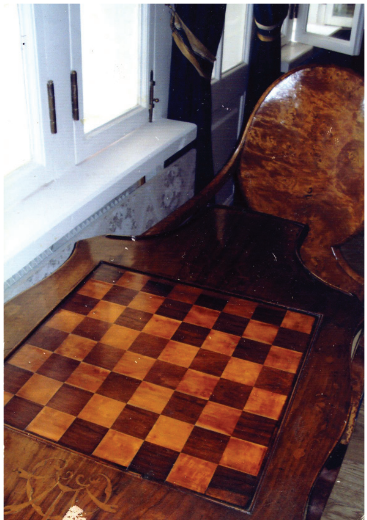
В музее этого главного здания находится в качестве экспоната шахматная доска. Тургенев любил играть в шахматы. Он – первый шахматист среди писателей.