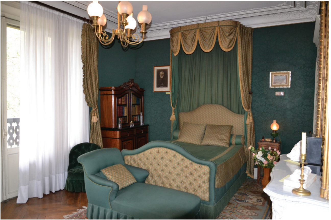
Париж. Буживаль. Спальня в вилле Тургенева