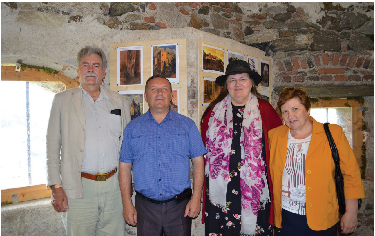
Великолепная четвёрка. В семейном кругу