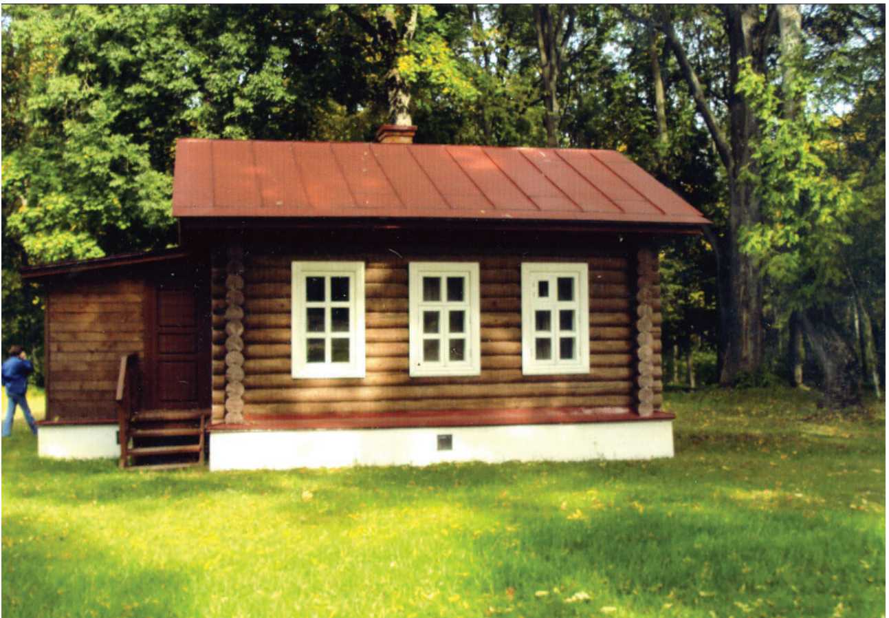
Банька, где собирались когда-то наши писатели-современники