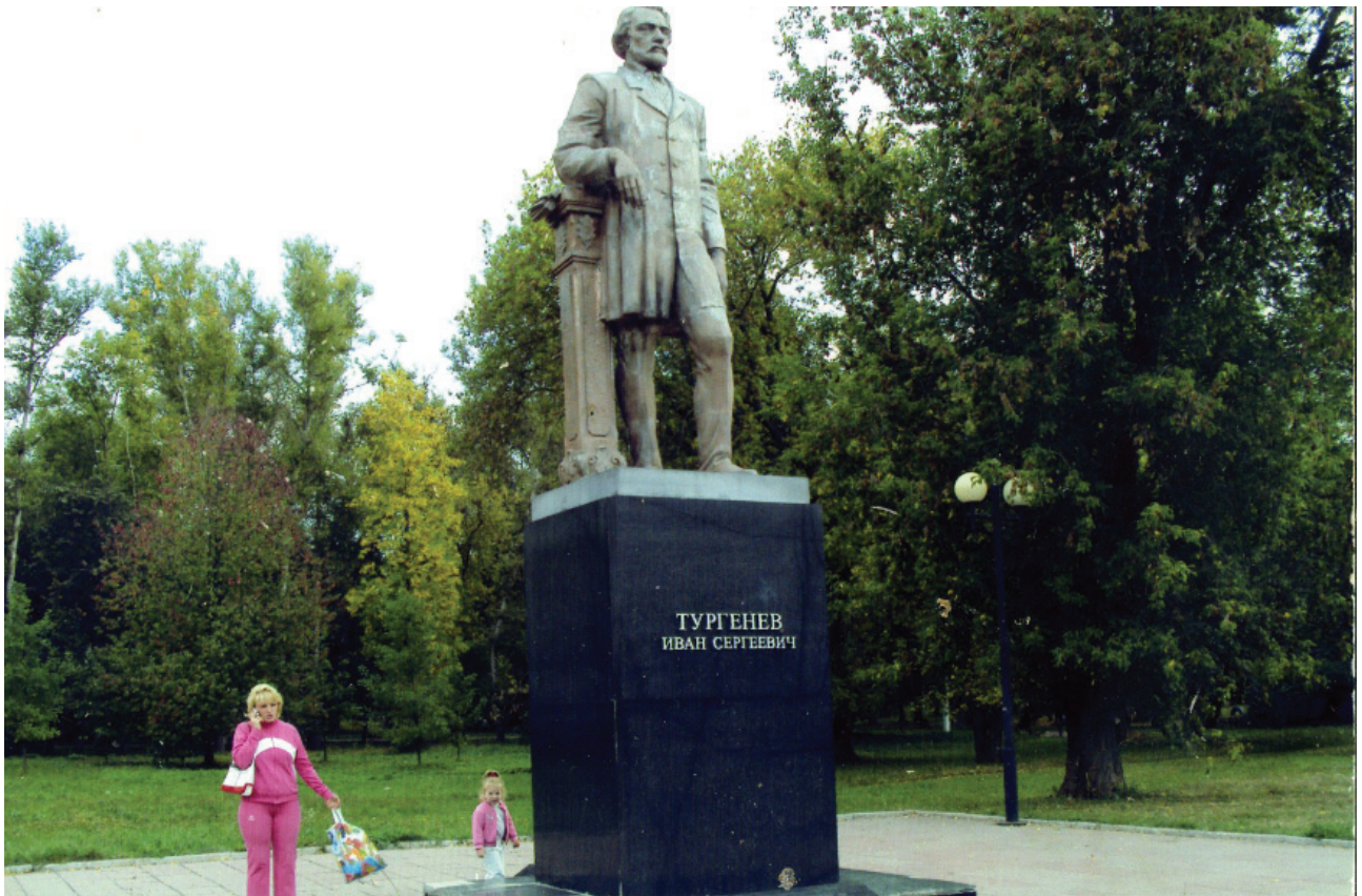
Опять же во Мценске. Памятник И.С. Тургеневу в городском парке. Работа скульптора Вячеслава Клыкова