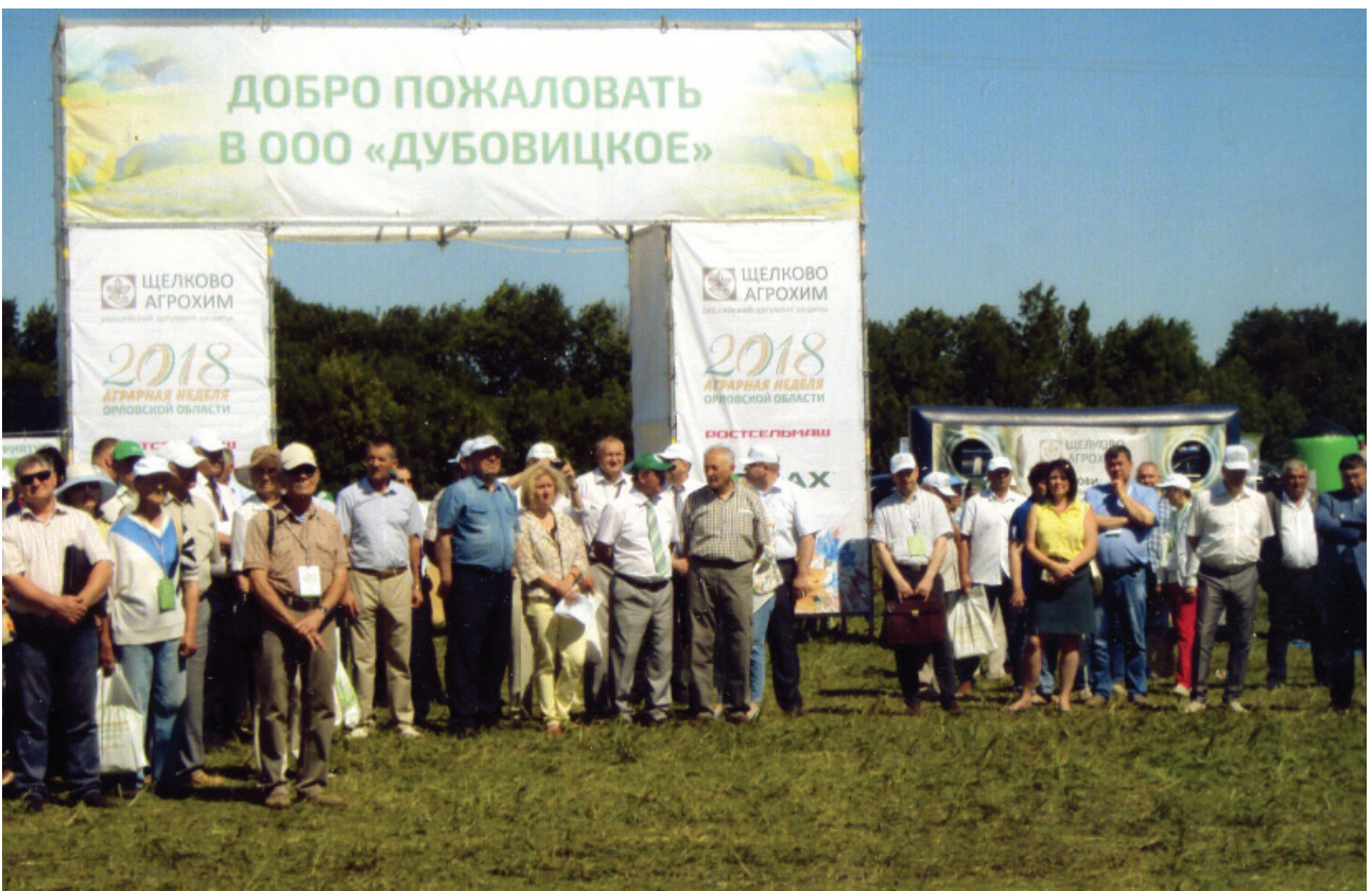
А это опять же на Орловщине в малоархангельском Дубовике, где ежегодно проходит всероссийский День поля, День русского поля. Участники и гости праздника у общего входа в места, где проходит это мероприятие