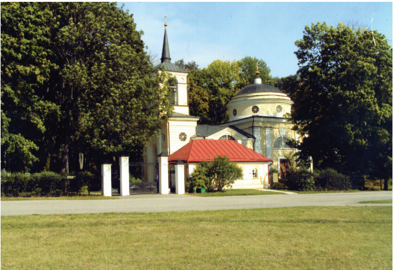
А вот оно само, это Спасское-Лутовиново. Центральный вход в тургеневскую усадьбу