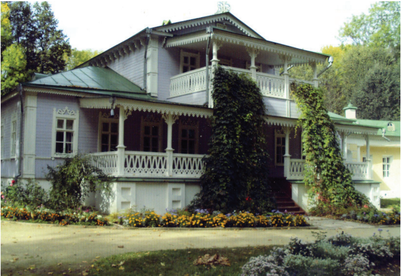
Вот и главное здание тургеневской усадьбы