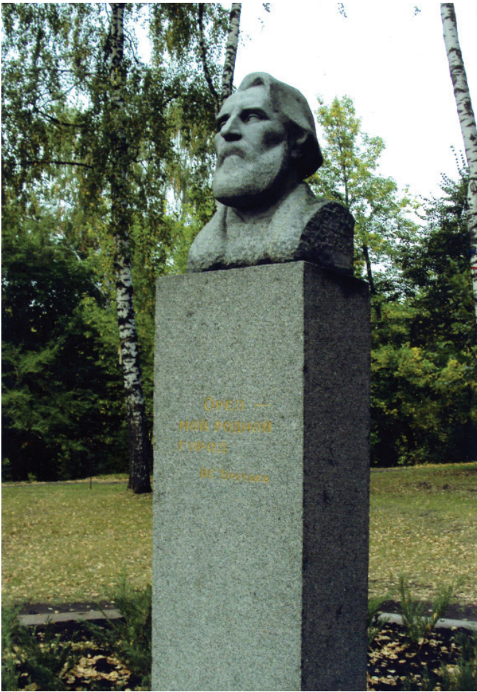
Бюст И.С. Тургенева на Дворянском гнезде